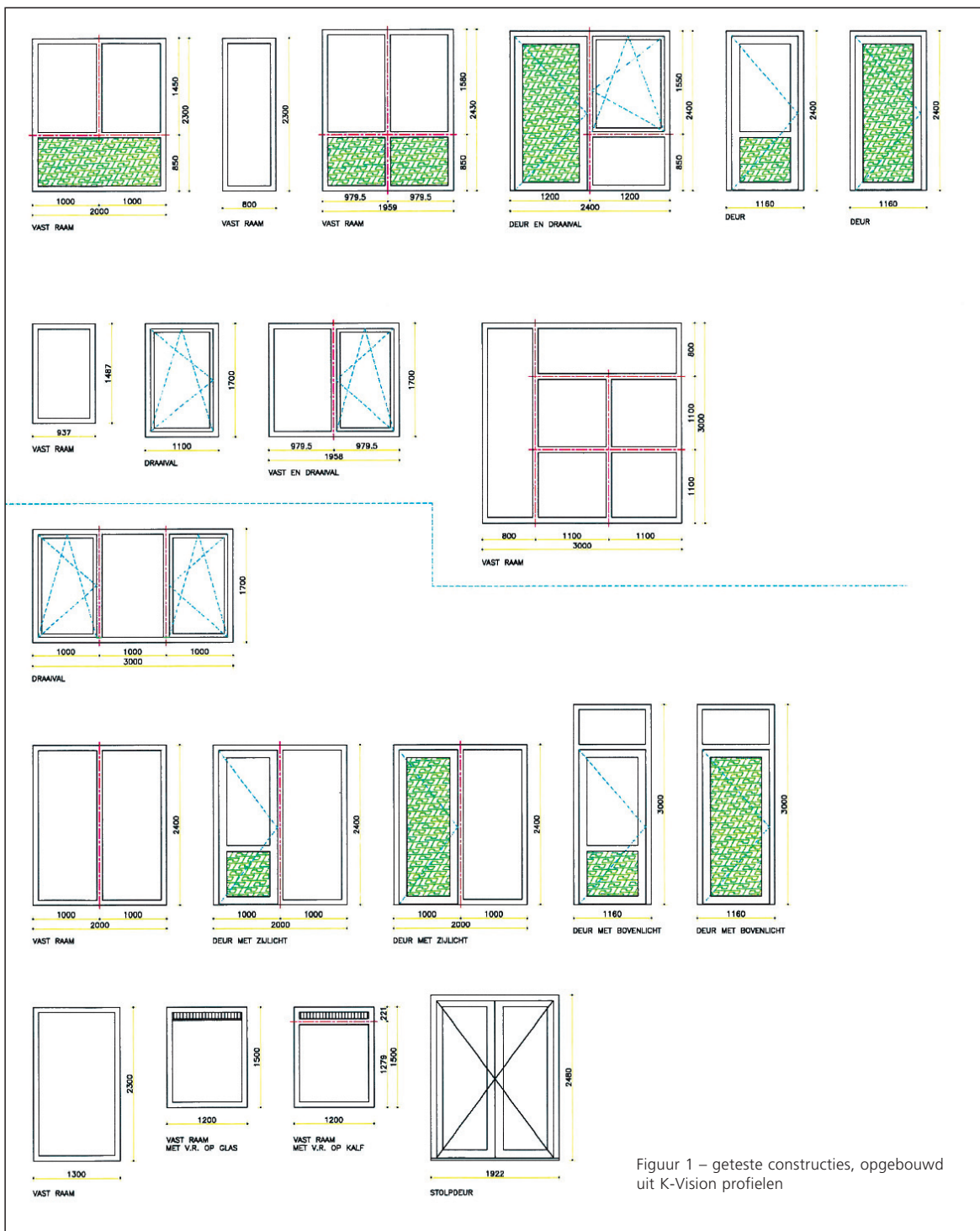
Figuur 1 – geteste constructies, opgebouwd uit K-Vision profielen

De geteste constructies zijn weergegeven in Figuur 1.